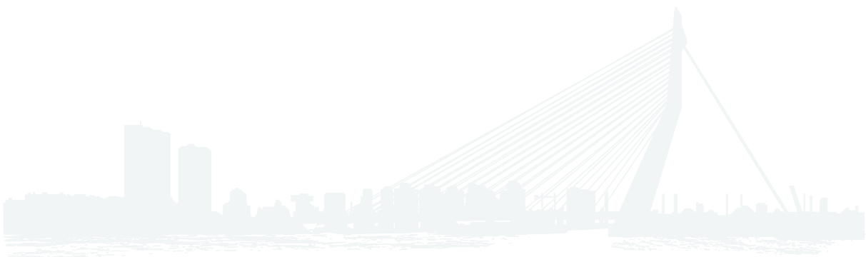
te maken situatie